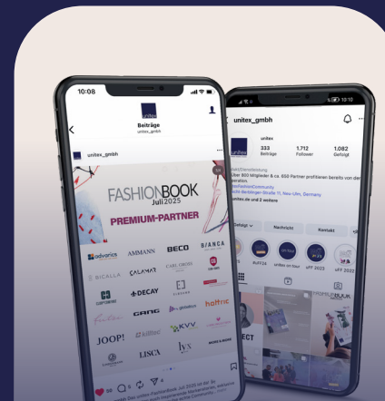
Posts auf allen unitex Kanälen