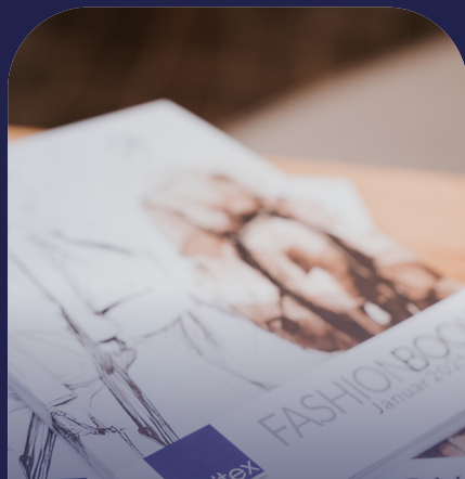
Auslage unitex- FashionFestival